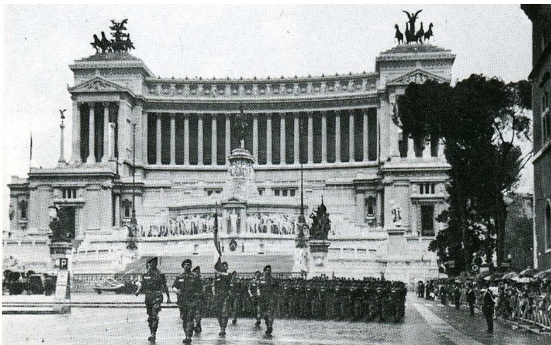
Roma – 2 giugno